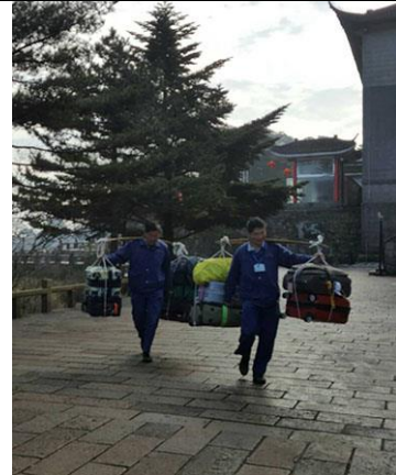
ลูกหาบแบบสัมภาระรับ-ส่งโรงแรมไปสถานีกระเช้า